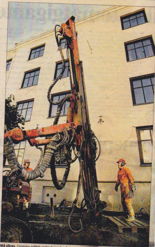
Må sikres. Grunnen sviktet under denne bygården i Trudvangveien på Majorstuen. Oslo kommune har arbeidet med å sikre bygningene de tre siste ukene.