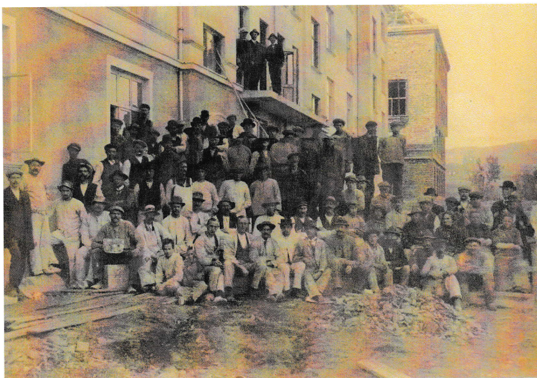
Arbeidslaget Trudvang anno 1916